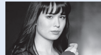
ALICE SARA OTT